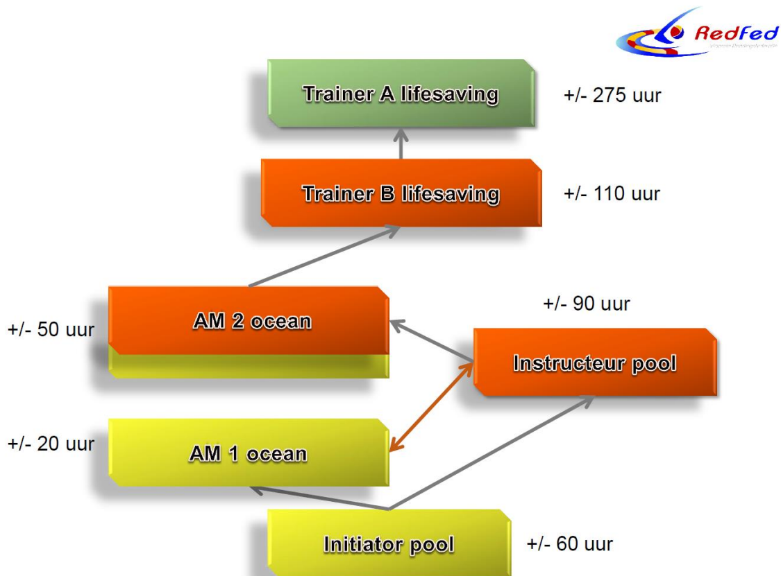
Figuur 2: Schema trainers opleidingen Reddend zwemmen

De Directeur Sportkader Opleidingen (DSKO) ontwikkelde i.s.m. Sport Vlaanderen een nieuwe blauwdruk voor de opleidingen waardoor eerst een instructeur-B uitgewerkt moest worden. De nieuwe cursustekst trainer-B zal in 2019 opgesteld worden.